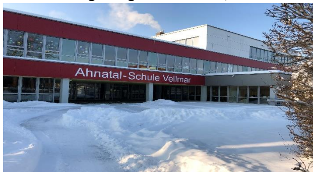
Die ASV im Februar 2021 "schneefrei"

Ob man nun gläubig ist oder nicht, die Botschaft zeigt uns aber einen Weg aus der Sorge auf und sicher ist sie in der Lage, den einen oder die andere mit Hoffnung zu erfüllen.