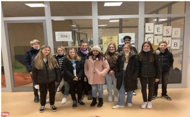
Unsere Vorleserinnen und Vorleser am Vorlesetag